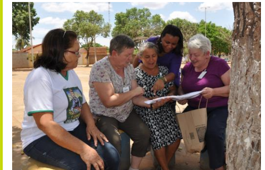
22 oktober - 2 november

5 KVLV-vrouwen trekken naar Brazilië en maken kennis met Braziliaanse plattelandsvrouwen die actief zijn in de vrouwelijke tak van Unicafe's, de koepel van familiale landbouwcoöperaties.